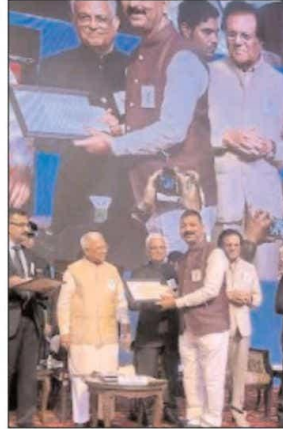
गीत प्रतियोगिता में

बोरावा/25 जनवरी 2023/, निर्वाचन आयोग भारत सरकार नई दिल्ली द्वारा राष्ट्रीय मतदाता दिवस के अवसर पर राष्ट्रीय स्तर पर मतदाता जागरूकता प्रतियोगिता (National Voter Awareness Competition) का अयोजन समस्त महाविद्यालय एवं विश्वविद्यालय स्तर पर सत्र 2022 हेतु किया गया था। जिसमें देश भर के महाविद्यालय एवं विश्वविद्यालय ने सहभागिता कि थी। राष्ट्रीय स्तर पर आयोजित इस प्रतियोगिता में गुलाब बाई यादव स्मृति शिक्षा महाविद्यालय बोरावा ने भी संस्थागत सहभागिता कि थी। विभिन्न चरणों में आगे रहते हुए संस्था ने सफलता